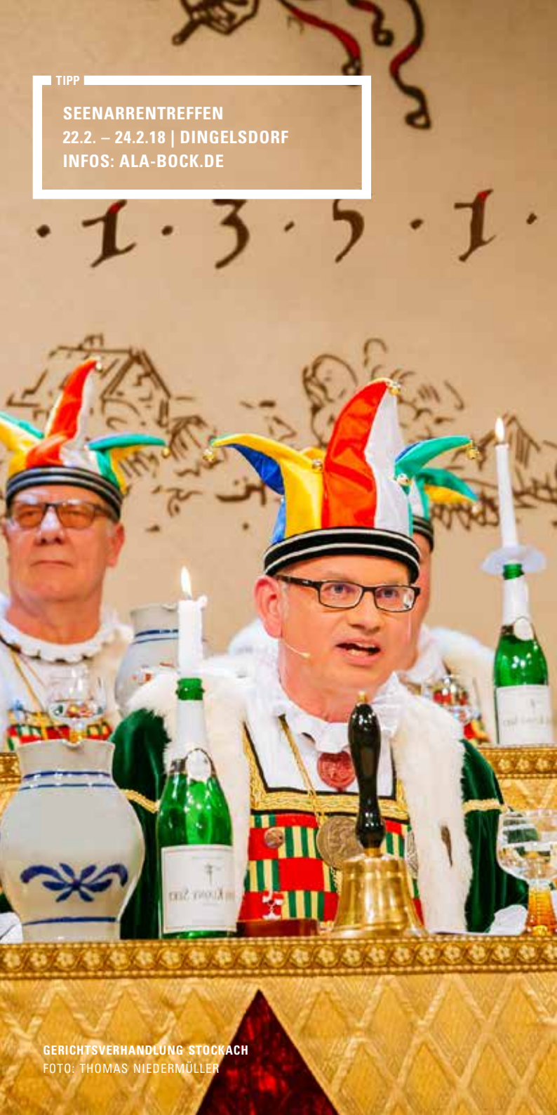
GERICHTSVERHANDLUNG STOCKACH