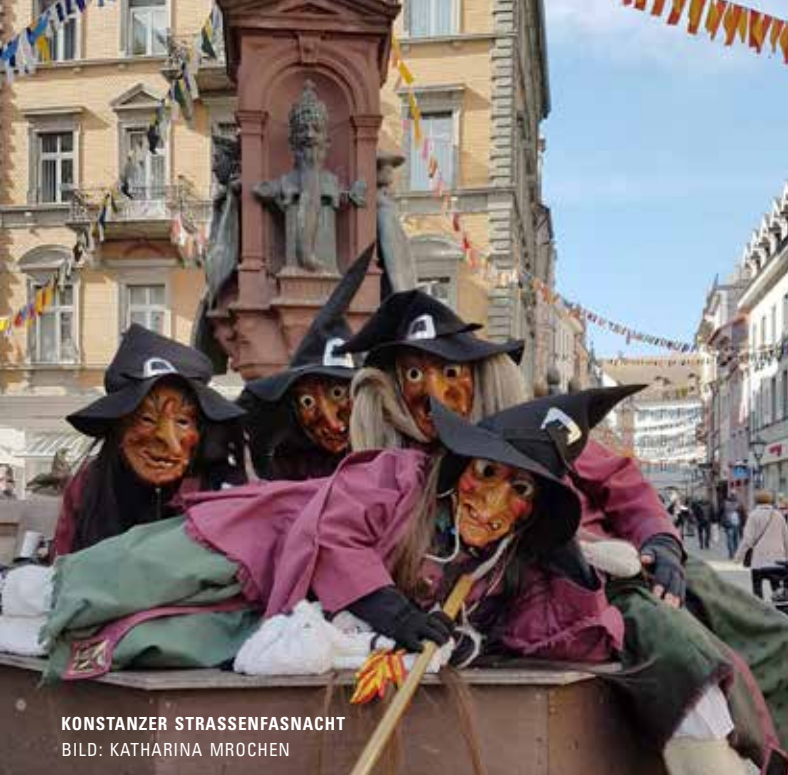
KONSTANZER STRASSENFASSNACHT