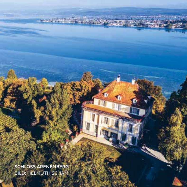
SCHLOSS ARENENBERG