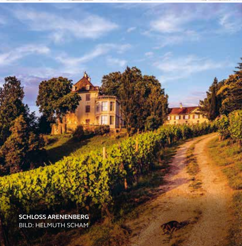
SCHLOSS ARENBERG