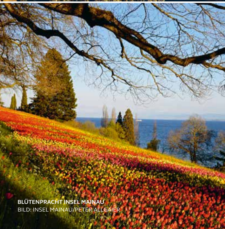
BLÜTENPRACHT INSEL MAINAU