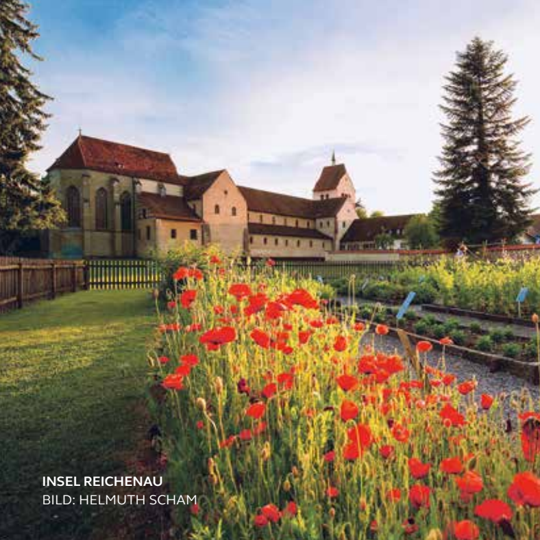
INSEL REICHENAU