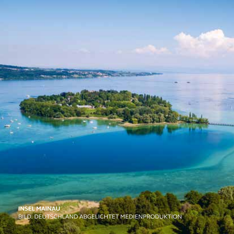
INSEL MAINAU