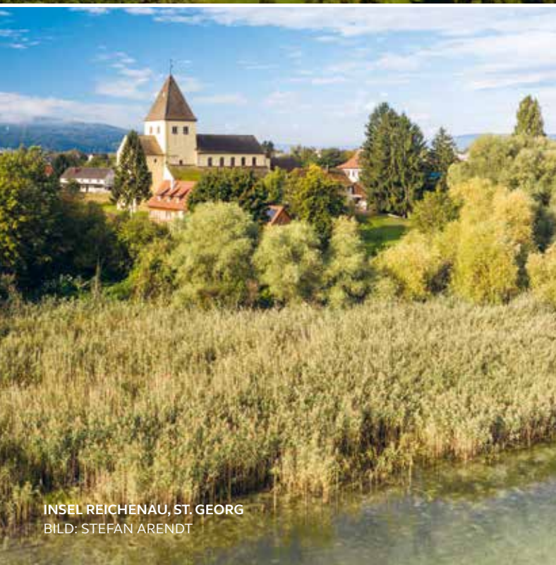
INSEL REICHENAU, ST. GEORG