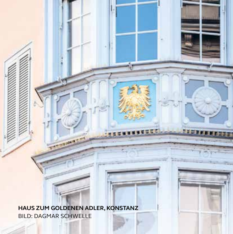
HAUS ZUM GOLDENEN ADLER, KONSTANZ